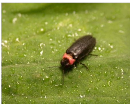
ヒメボタル 実際は体長7mm