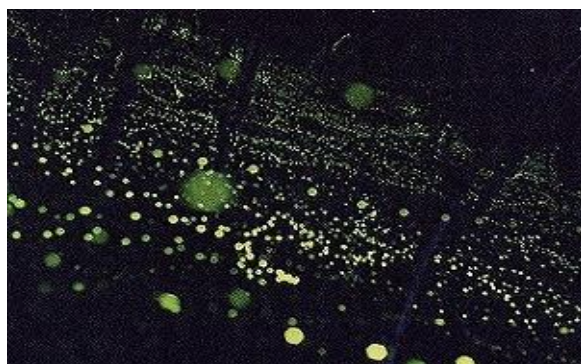
ヒメボタルの明滅の軌跡